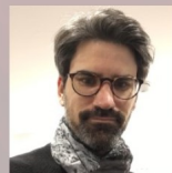
Pr Florent Espitalier, PUPH CHU Nantes